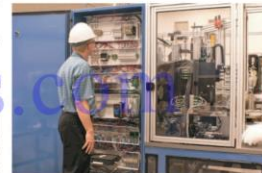
งานซ่อมบำรุง (Maintenance) งานฝ่ายผลิตและห้องปฏิบัติการ